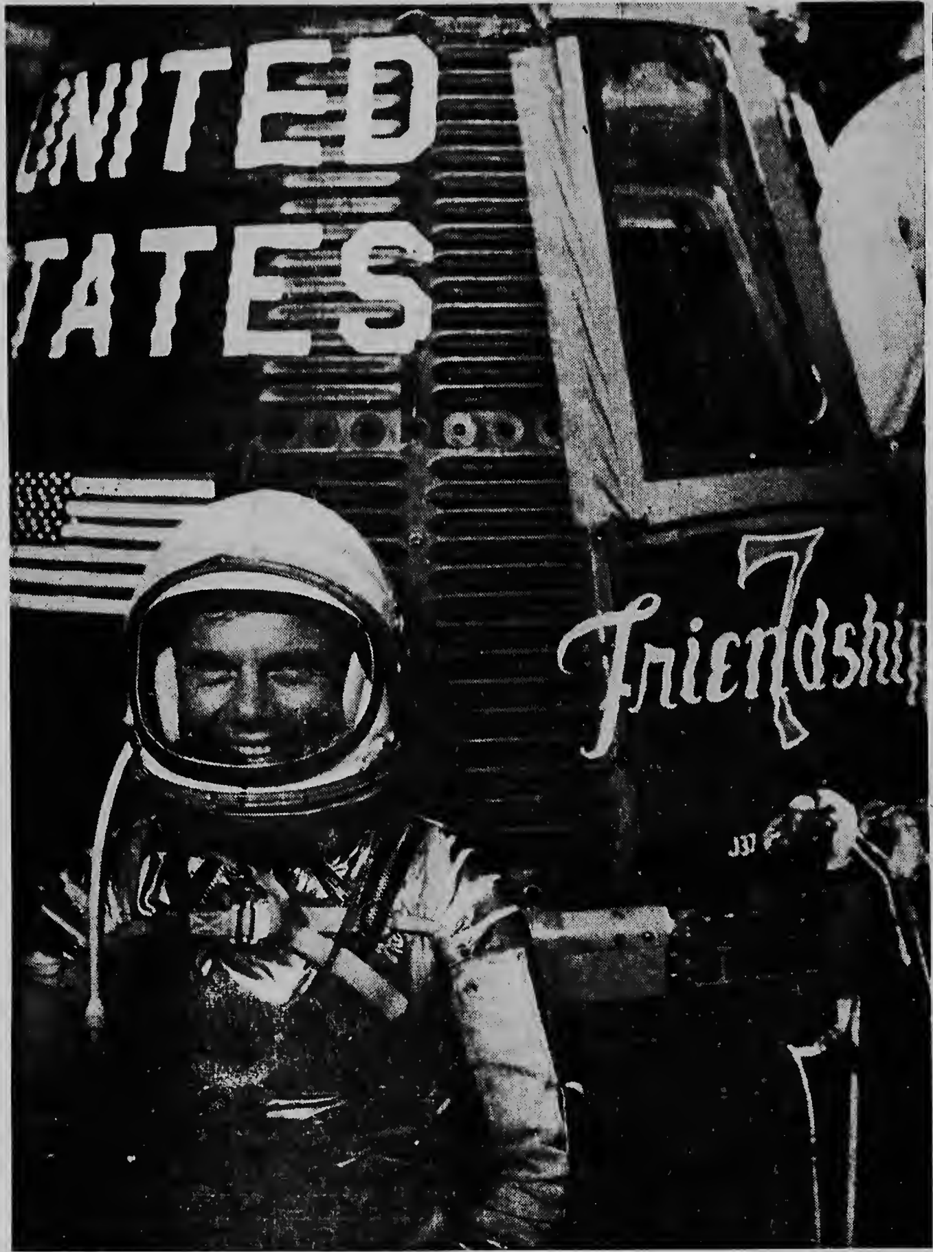
Aquí nos ta mira Astronauta John Glenn para dilanti di su capsula di espacio Mercury, Friendship VII, den cual aparato afera mainta el a ser lanza for di base americano di raket na Cape Canaveral.